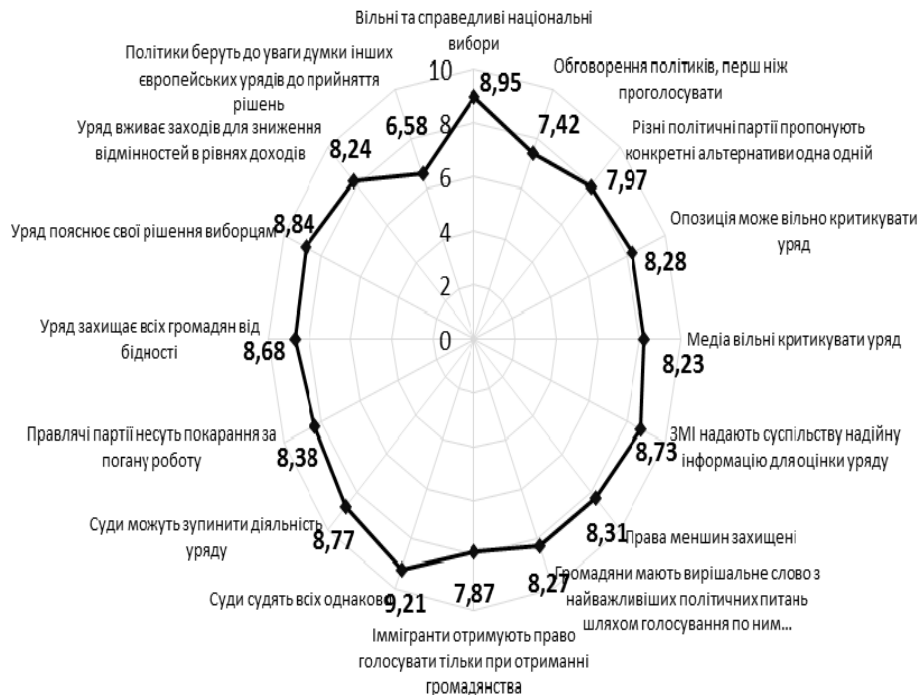
Рис. 1. Основні демократичні принципи