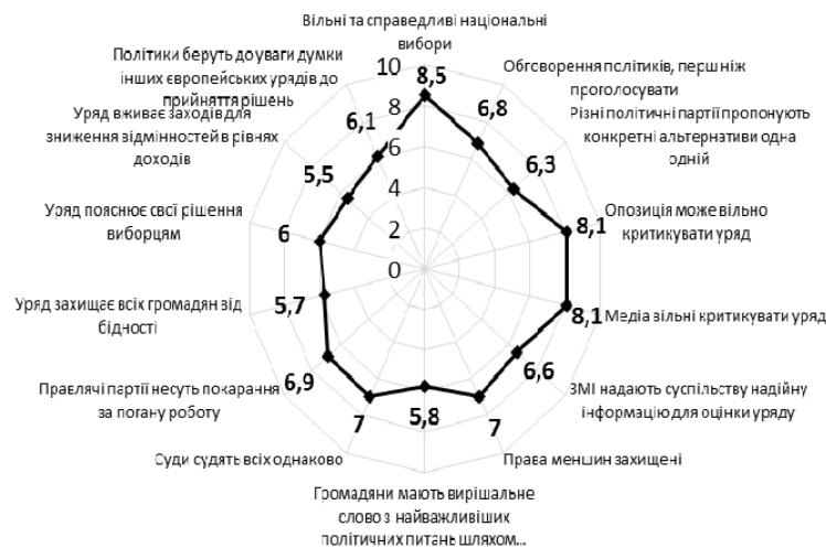
Рис. 3. І профіль функціонування основних демократичних цінностей (середні значення серед країн, які віднесено до даного профілю)

У результаті аналізу було виокремлено країни, які найбільш повно забезпечують такі елементи, як проведення незалежних виборів, захист уразливих груп (захист прав меншин), чесна та незалежна судова система, відповідальність уряду – за свою діяльність у разі негативних наслідків та пояснення своєї політики громадянам (рис. 3).