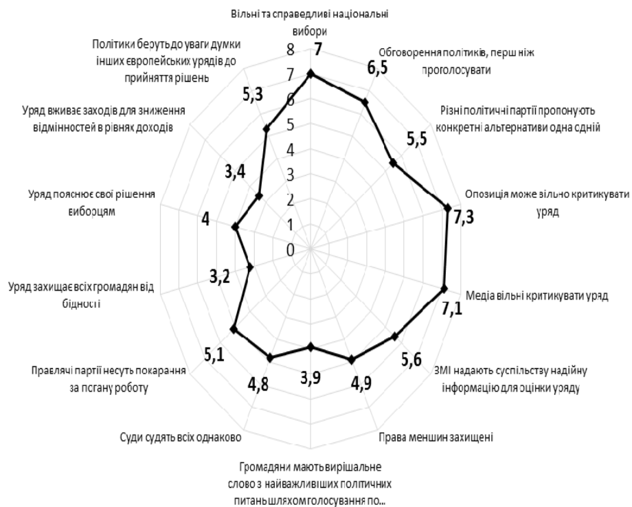
Рис. 2. Дотримання демократичних цінностей в країнах Європи (середні значення, шкала від 1 до 10, де 10 – "повністю дотримується")